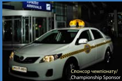
Спонсор чемпіонату/ Championship Sponsor

The distance from the hotel to the city center is 6-7 km (10 minutes by subway), to the railway station - 10 km (15 minutes by subway), to the international airport «Boryspil» - 30 km (25 minutes by taxi)