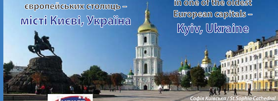
Софія Київська / St.Sophia Cathedral

The 8th European Chess Solving Championship -2012 in one of the oldest European capitals – Kyiv, Ukraine