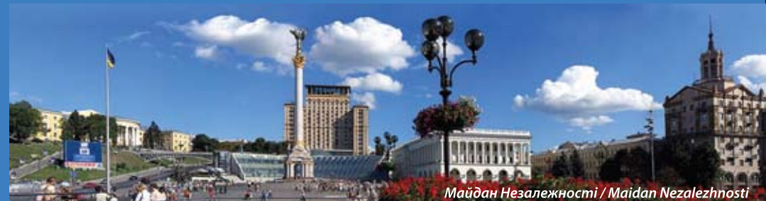
Майдан Незалежності / Maidan Nezalezhnosti